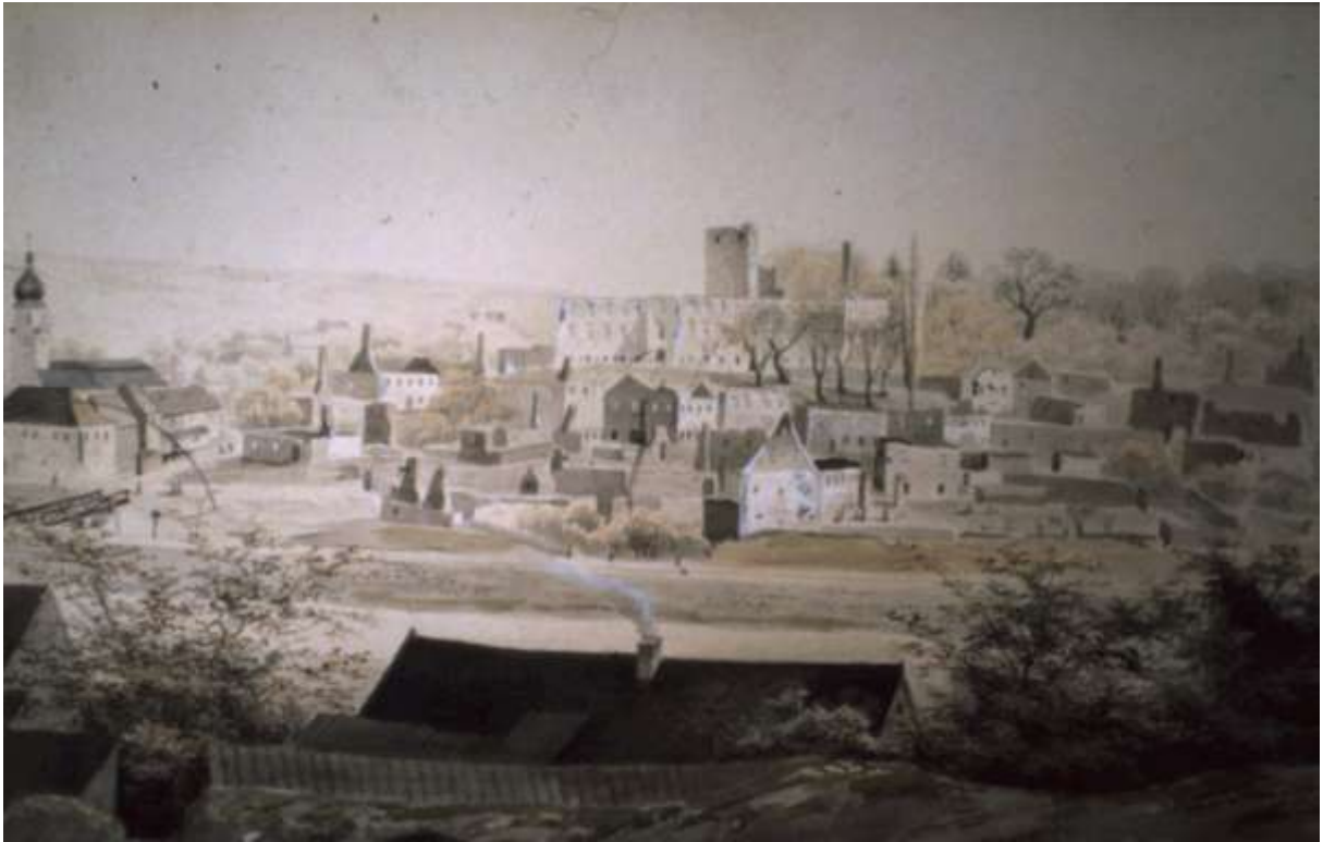
1852 nach dem Brand