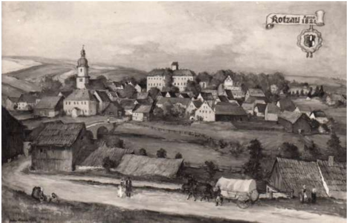
gemalt von Anton Richter 1963