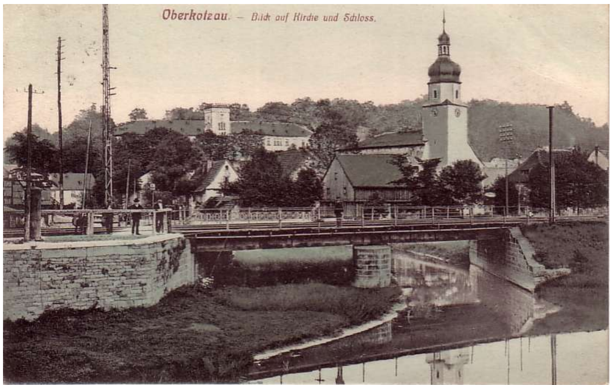
1906 Saalesteg mit Schranke