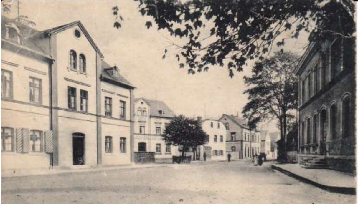
Bahnhofstraße um 1910