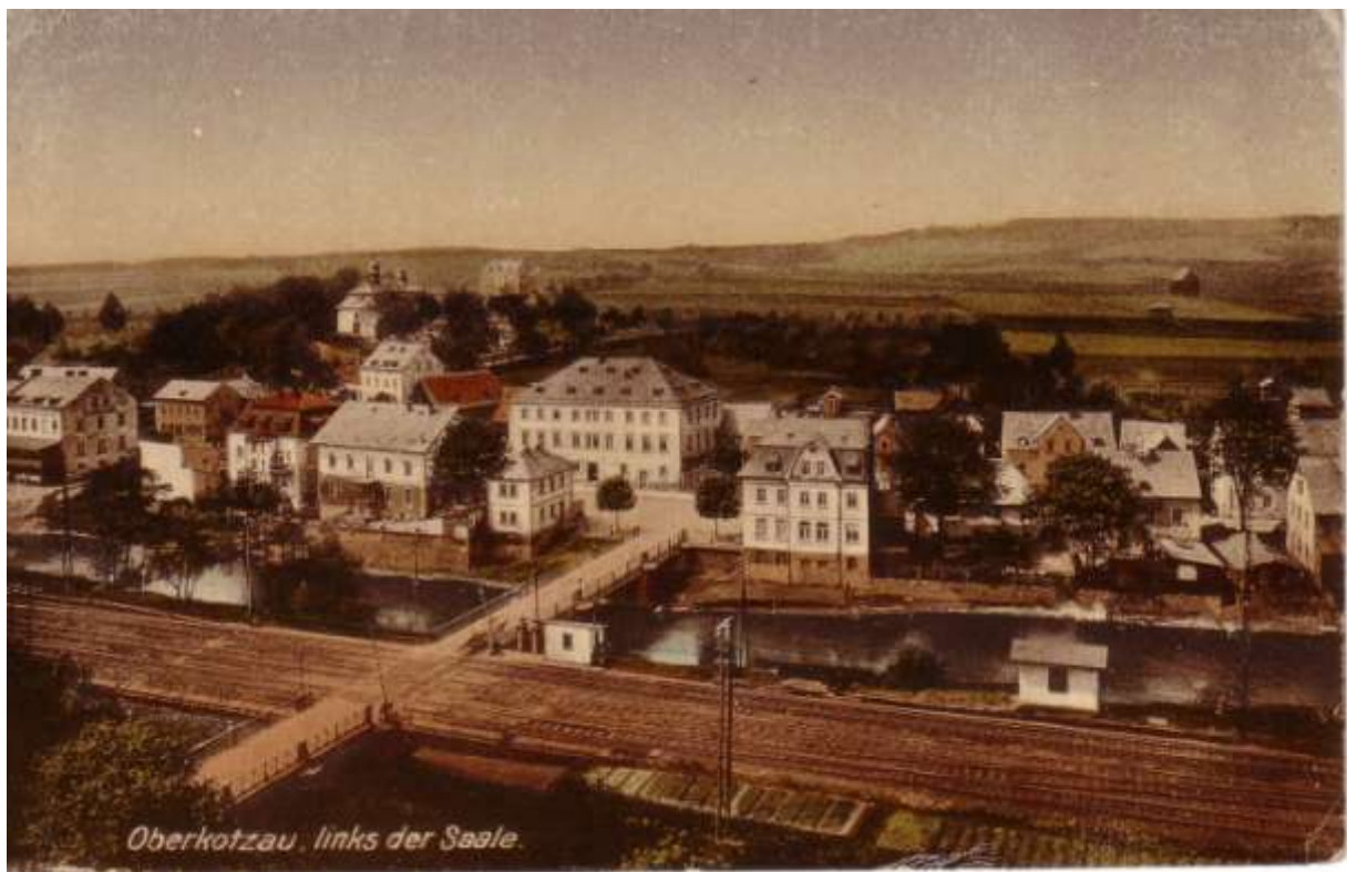
Um 1900 links der Saale