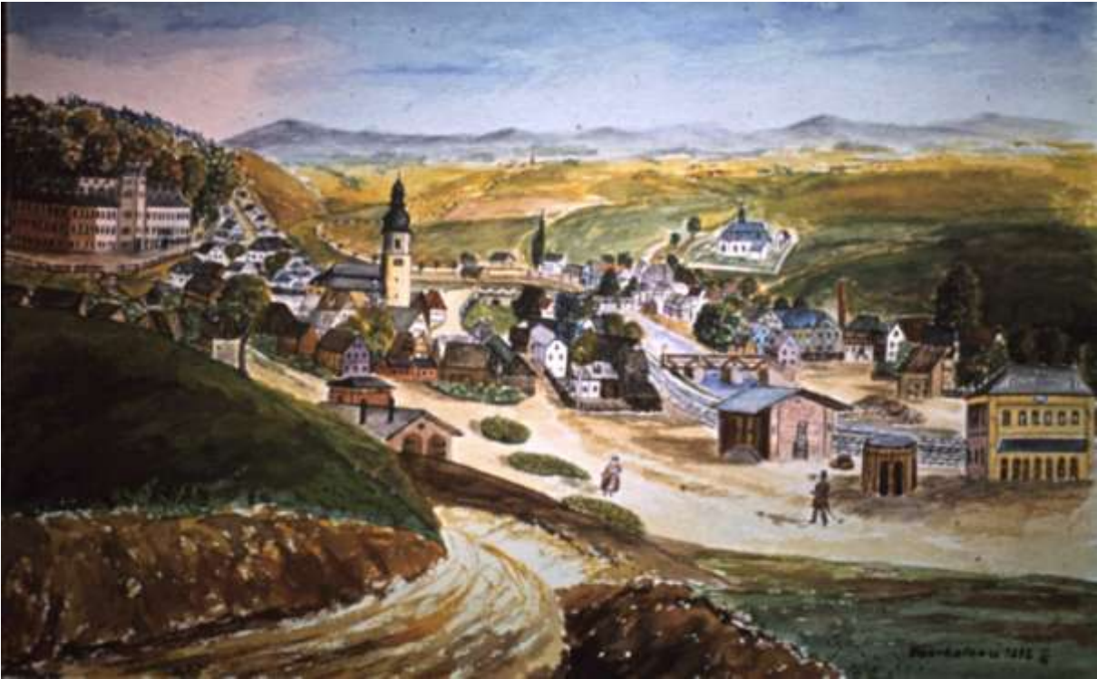
von Richard Schörner nach einer Zeichnung von E. Rauh 1872