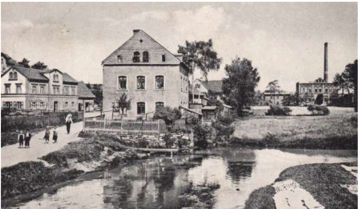
Partie a. d. Schwessnitz 1914