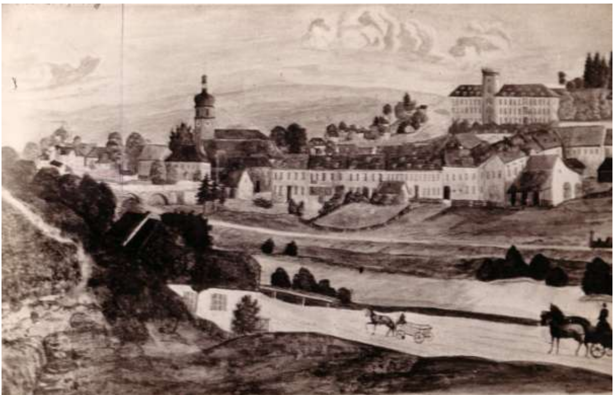
um 1870 (Marktplatz)