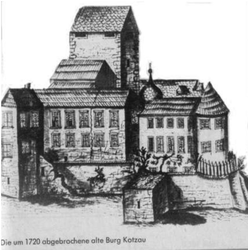
Die um 1720 abgebrochene alte Burg Kotzau