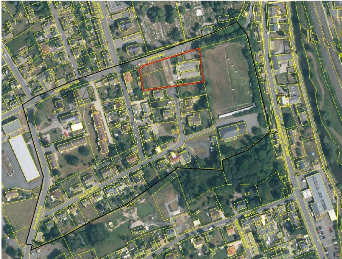
Luftbild der Grundstücksfläche o. M.

Das Grundstück ist von einer Leitungstrasse (Mischwasserkanal) durchzogen, welche dinglich zu sichern ist.