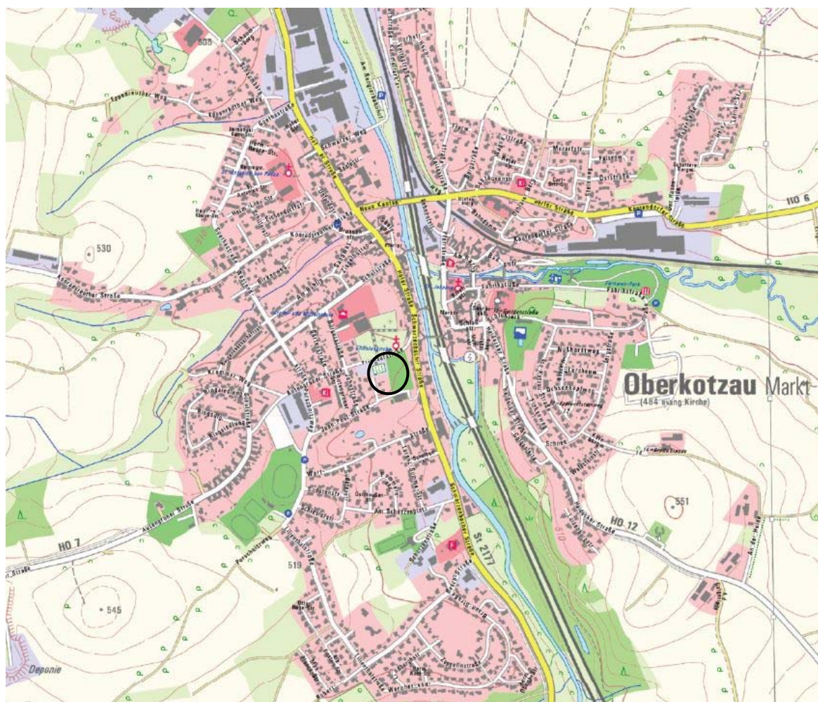
Übersichtslageplan o. M.