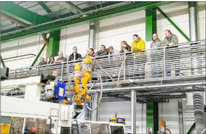
Werksbesichtigung durch die VHS Hofer Land bei GEALAN Formteile

Auf großes Interesse stieß die von der Volkshochschule Hofer Land organisierte Werksbesichtigung beim Oberkotzauer Familienunternehmen GEALAN Formteile am 25.11.2025. Insgesamt 13 interessierte Teilnehmerinnen und Teilnehmer nahmen an der Veranstaltung teil und nutzten die Gelegenheit, einen Blick hinter die Kulissen zu werfen.