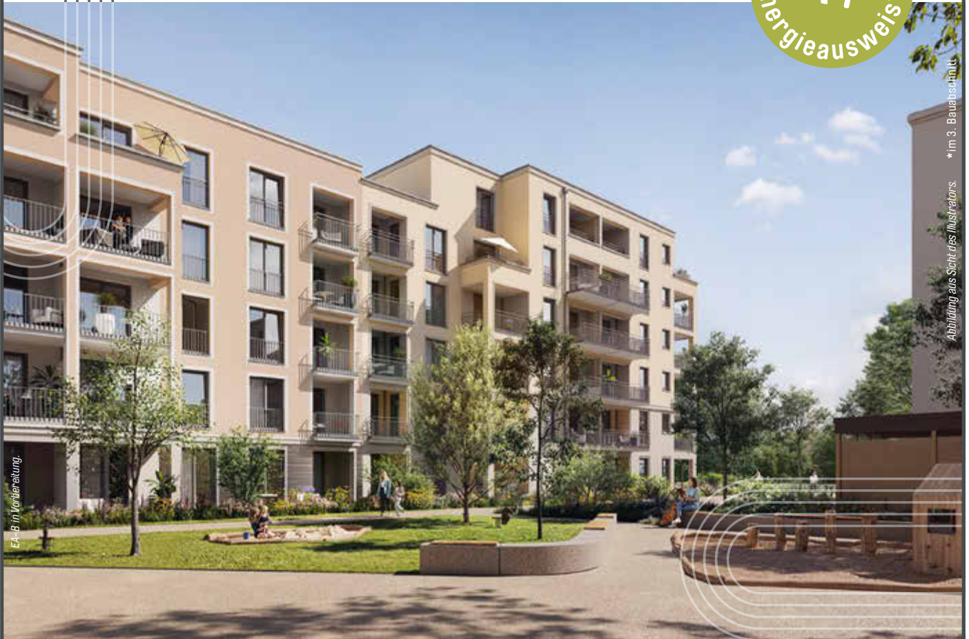
EA-B im Vordergrund.